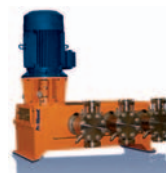
Die Prozess-Membranpumpe TriPower API 674

Unsere Innovationen vereinen Effizienz, Sicherheit und Umweltschutz!